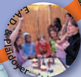
E.A.D. & Plaidoyer